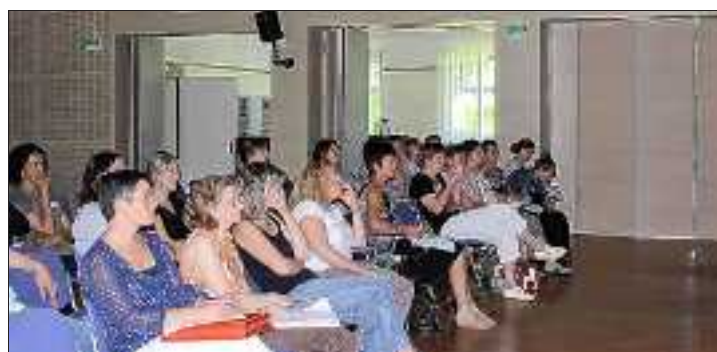
La prise en charge de la personne âgée a été au centre du colloque organisé dernièrement au centre hospitalier par le Réseau Alsace Gériatologie.

La prise en charge des personnes âgées et personnes atteintes de la maladie d'Alzheimer est au centre des préoccupations des professionnels du secteur de la gérontologie. Les acteurs soignants du territoire de proximité de Colmar/Guebwiller ont abordé ces difficultés lors d'un colloque qui s'est tenu jeudi au centre hospitalier de Rouffach.