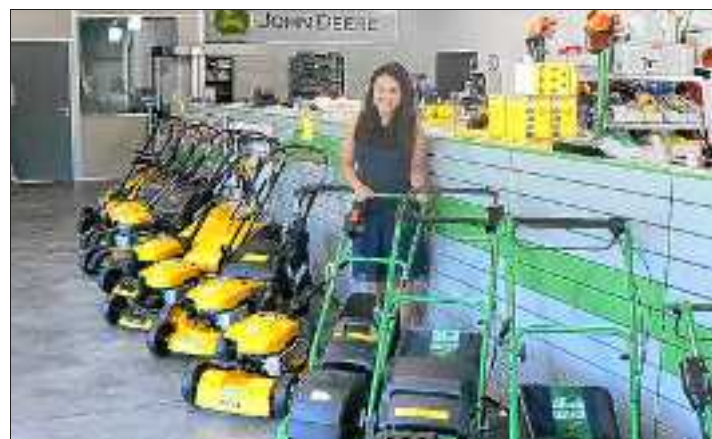
Agri 68 vient d'ouvrir à Hattstatt un site très accueillant.